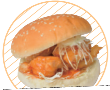
カンガルードッグ