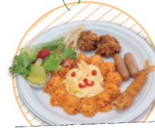
オムライオンプレート