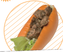
クロコダイルバーガー